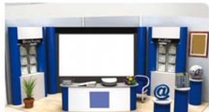
گرفه های کلاس F