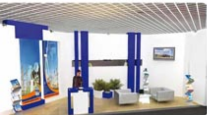
گرفه های کلاس E