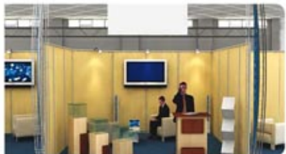
گرفه های کلاس B